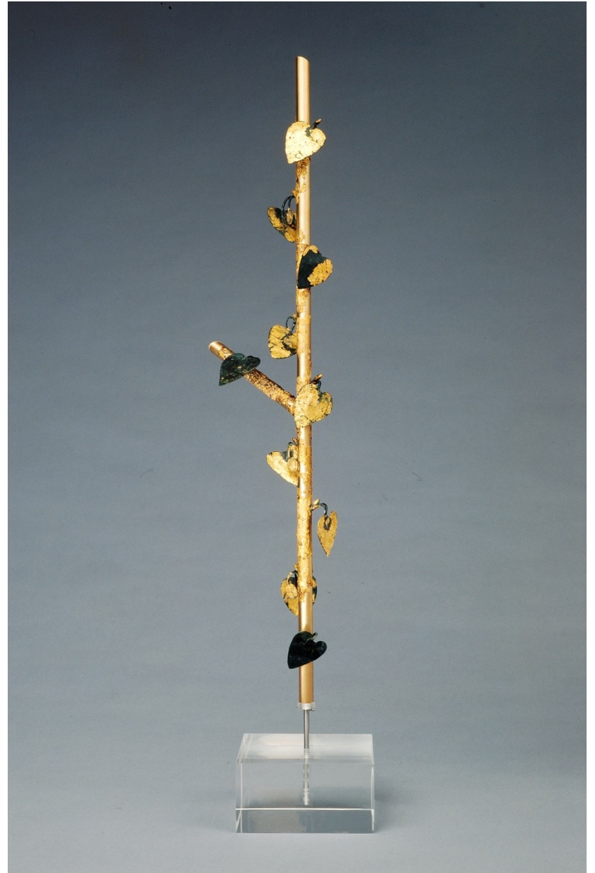
Kultbäumchen, Manching