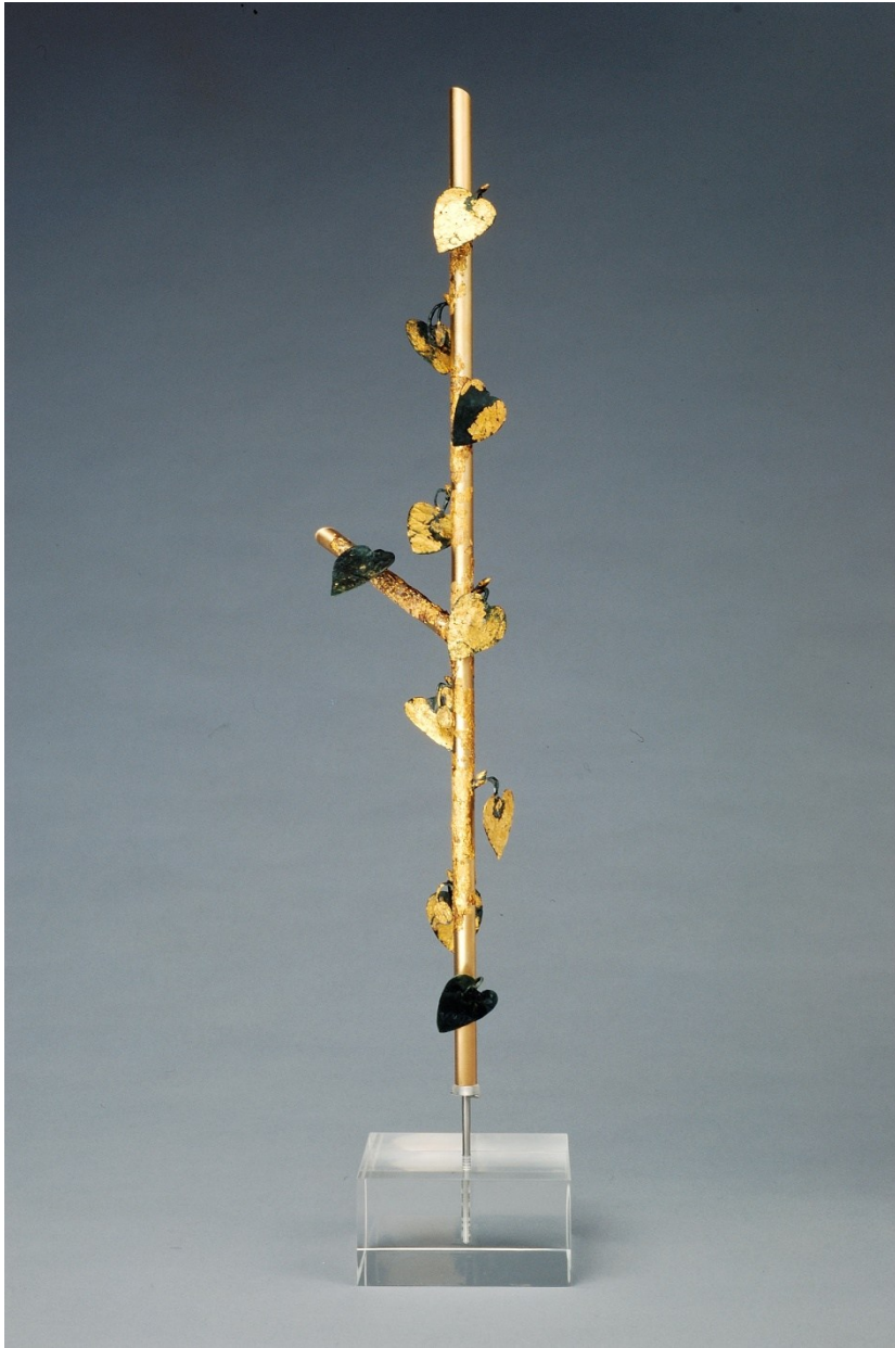
© Kultbäumchen, Manching © Archäologische Staatssammlung, Manfred Eberlein