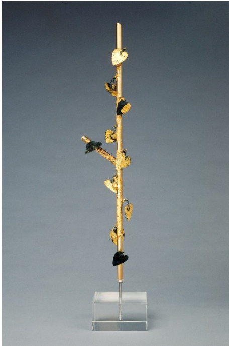
Kultbäumchen, Kelten-Römer-Museum Manching