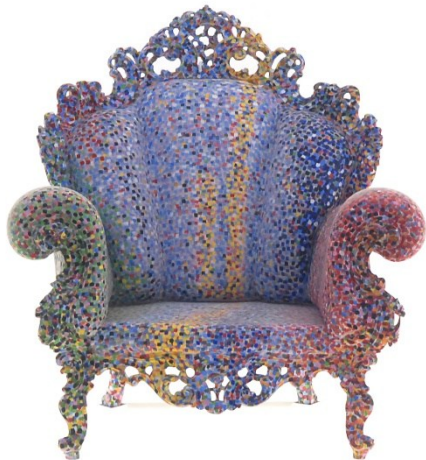
Poltrona di Proust, von Alessandro Mendini, 1978, Die Neue Sammlung – The Design Museum, Pinakothek der Moderne

© Foto: Die Neue Sammlung – The Design Museum (A. Lorenzo), Objektrecht: Courtesy Atelier Mendini