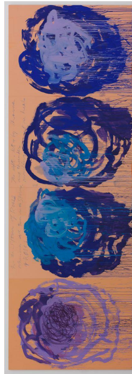
Cy Twombly, Untitled (Roses), 2008 © Cy Twombly Foundation.