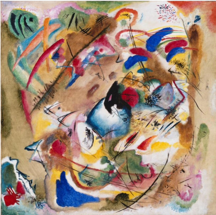
Wassily Kandinsky, Träumerei, 1913, Bayerische Staatsgemäldesammlungen – Pinakothek der Moderne, München

CC BY-SA 4.0 https://creativecommons.org/licenses/by-sa/4.0/