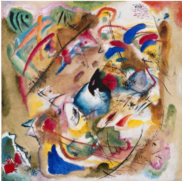
Wassily Kandinsky, Träumerei Improvisation, 1913

📍 Bayerische Staatsgemäldesammlungen – Pinakothek der Moderne, München