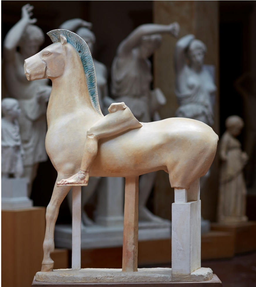
CC BY NC ND, Museum für Abgüsse Klassischer Bildwerke, Foto: Roy Hessing