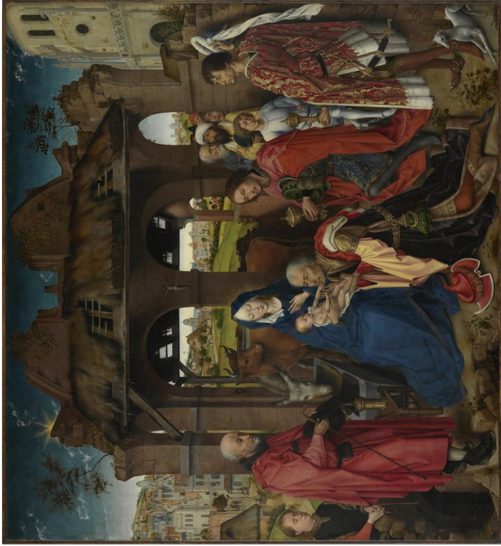
Anbetung der Könige | von Rogier van der Weyden | um 1455 | Mitteltafel des Columba-Altar | Eichenholz | 139,5 x 152,9 cm | Alte Pinakothek, München