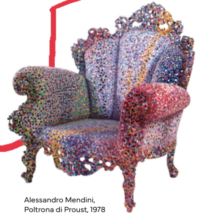
Alessandro Mendini, Poltrona di Proust, 1978