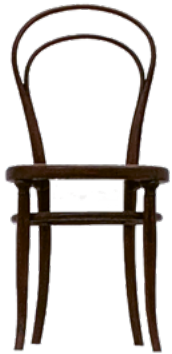
Michael Thonet, Stuhl Nr. 8, 1857/58

Stuhl und Sessel prahlen mit ihren Vorzügen!